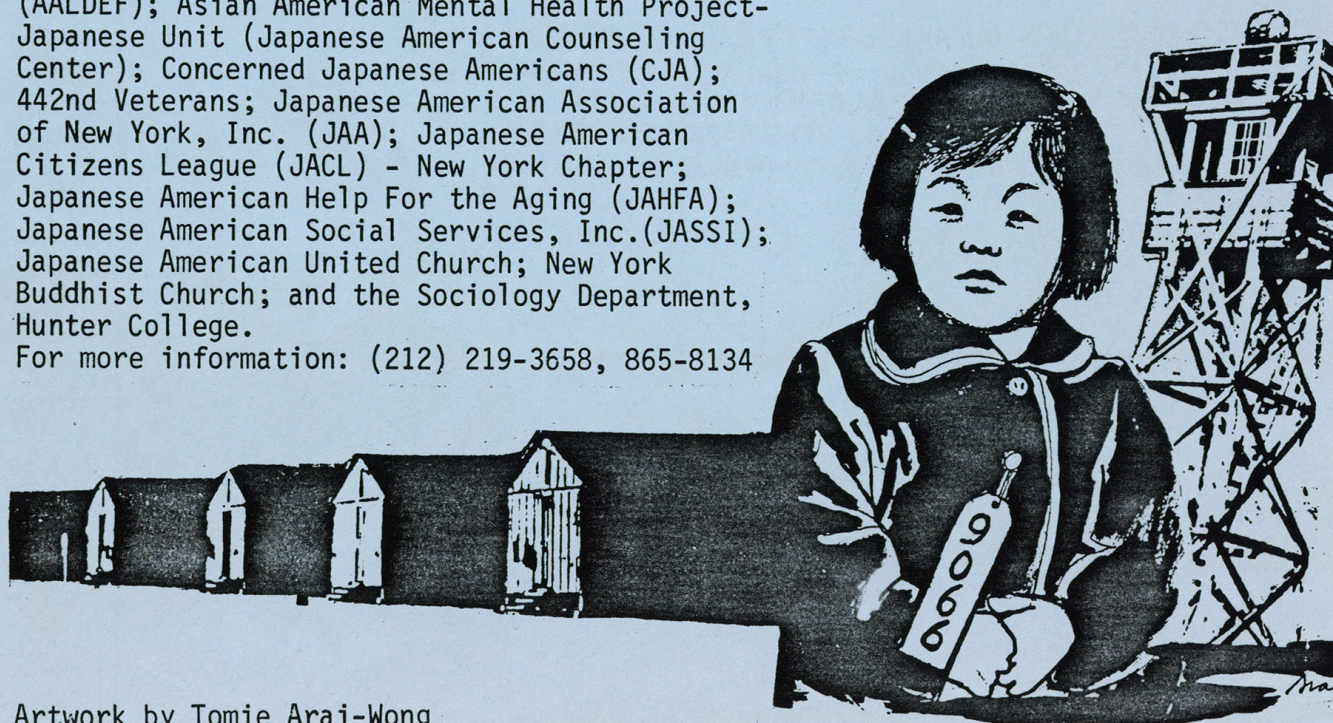
Artwork by Tomie Arai-Wong

For more information: (212) 219-3658, 865-8134